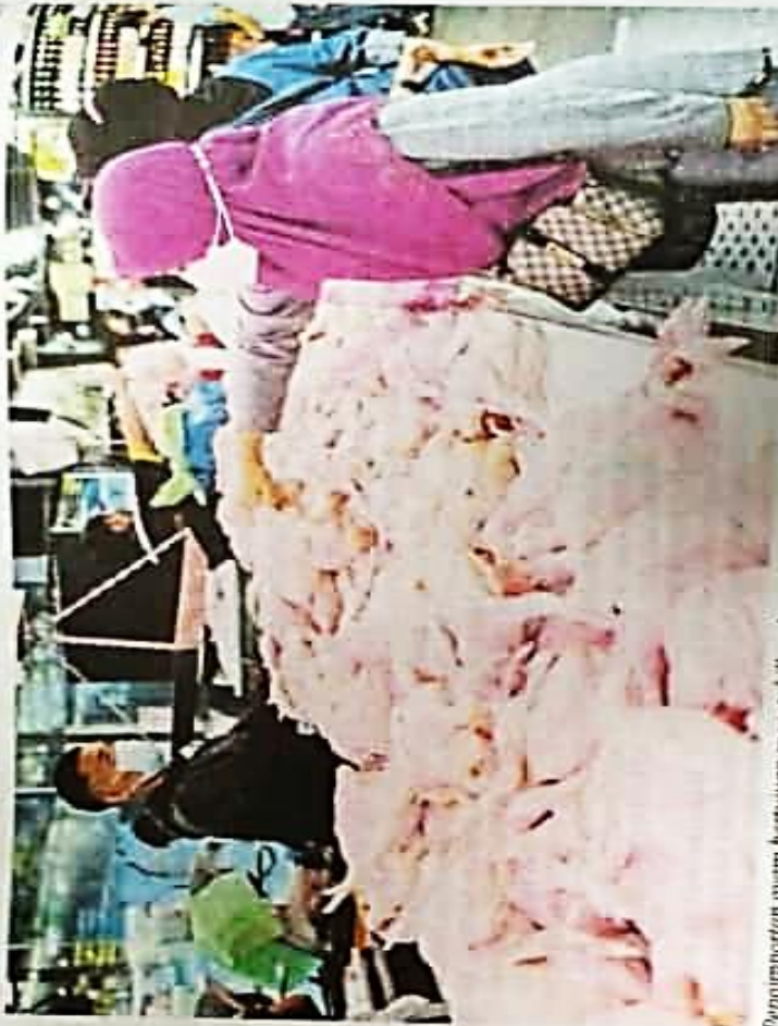
Pengimportan ayam bertujuan menstabilkan keperluan bekalan ayam negara.

"Bekalan ayam seterusnya akan dibawa masuk ke dalam negara pada Isnin (esok), iaitu tiga kontena yang akan ditempatkan di bilik sejuk beku NAFAS di Sungai Bakap, Pulau Pinang," menurut kenyataan berkenaan.