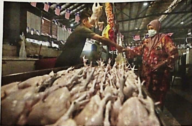
ORANG ramai membeli ayam segar di pasar Chabang Tiga, Kuala Terengganu.